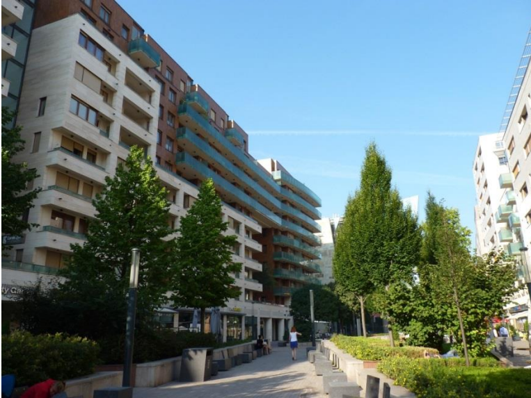
1. kép A Corvin-sétány.

Az interjúkban a VIII. kerületet többnyire egy sokszínű városrészként jellemezték. A leggyakrabban az életkort, a nemzetiségi és etnikai hovatartozást, az életstílust, az anyagi helyzetet és a munkaerőpiaci helyzetet emelték ki, mint a különbségek dimenzióit. Józsefvárost a városrehabilitáció következtében egy gyorsan változó területként írták le, ahol sok belföldi és külföldi beköltöző, bevándorló él. A leggyakrabban említett csoportok: problematikus vagy fenyegetőnek tartott emberek, bevándorlók és új beköltözők, szegények, valamint a régóta a kerületben élők, ezen belül különösen a nyugdíjasok, idősek.