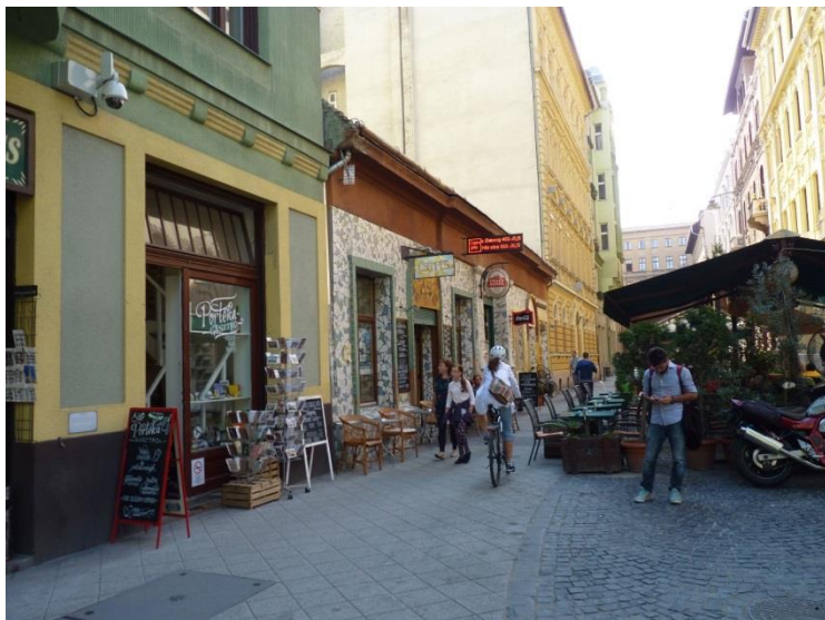
2. kép Új szolgáltatások, vendéglátóhelyek a Palotanegyedben.

„Kevés közterület van. Ugye a legelső az a Múzeum kert, azt rendszeresen használjuk. [...] Gutenberg téren van az egyetlen játszótérünk. Kis szerény, de van. Azt már kétszer felújították, úgyhogy viszonylag jó állapotban van. És a többi azok a sétálóutcák, és egyéb kisebb részek, amik meg nagyon nem működnek közterületként, hát a terek, ahol külön vendéglátó egységek vannak, Mikszáth tér és társai ilyen helyek. Egy-egy fesztiválkor nagyon jól működnek.” (R22, férfi, 48 éves, építész)