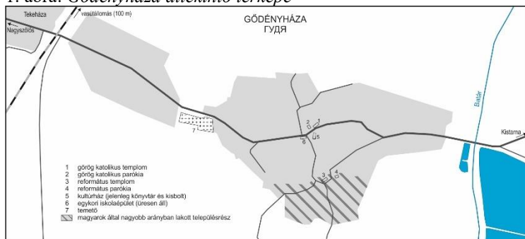
1. ábra: Gödényháza áttekintő térképe

A település morfológiailag két részre osztható: a hagyományos falumagra, amelynek központi terén a görög katolikus templomot és paplakot, a település klubházként és könyvtárként szolgáló épületét és egy vegyesboltot találunk. A református templom, amely körül napjainkban is a legtöbb református magyar család él, párszáz méterre helyezkedik el (1. ábra). A település újabb része a Tekeháza felé eső út mentén 1990 után, a kolhoz földterületének privatizálása nyomán alakult ki, és alapvetően kétemeletes családi házak alkotják.