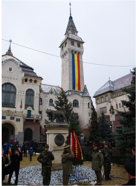
5. kép. Koszorúzás Marosvásárhelyen a december elsejei román nemzeti ünnep alkalmából

Ennek az önreprezentációnak a megalkotói – az egész székelvényföldi román közösség nevében – határozottan elutasítják a (magyar) kollektív kisebbségi jogok mindennemű bővítését, beleértve például a nyelvhasználati és oktatási jogokét is, mint ami aláásná a román nemzetállam alapjait. Ellenzik az autonomista