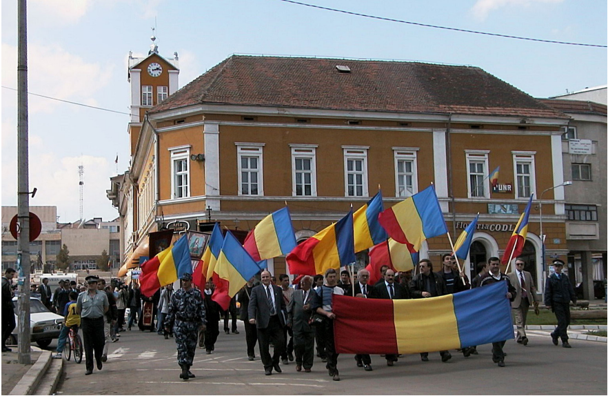
2. kép. Román tüntetés Sepsiszentgyörgyön.

Az évtizedeken át tartó konfliktus-, egyezkedés- és alkufolyamat eredményeképpen ugyan a helyi román elitnek nem őrizhették meg maradéktalanul korábbi pozícióikat, de nem is veszítették el mindet. A Székelyföldön így – Tánzos Vilmos klasszikus megfogalmazásával – egy sajátos, kettős hatalmi szerkezet jött létre. A választott önkormányzatok magyar dominanciájúvá váltak, míg a központi irányítású struktúrák (a román) nemzetállam bástyái maradtak. 18 Napjainkra egyértelművé vált, hogy – ellentétben az ismétlődően visszatérő szólamokkal – nem szűnt meg a román állam „tekintélye” a Székelyföldön, és a magyar autonomista mozgalom sem érte el célját. Ugyanakkor valóban bővültek az önkormányzatok jogkörei és lehetőségei, illetve sikerült biztosítani a magyar kisebbség etnokulturális reprodukciójának feltételeit – végeredményben a nemzetállami doktrínával szemben. Ezt az időnként mind román, mind magyar részről megkérdőjelezett egyensúlyi állapotot 19 az RMDSZ országos politikai szerepvállalása, illetve a romániai magyar