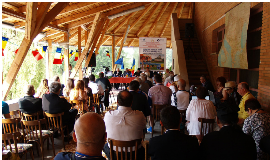
6. kép. Előadás a Marosfői nyári egyetemen

folytattak egy kutatást néhány Hargita és Kovászna megyei településen. A szociológusok egy létében fenyegetett, nyomás alatt álló kisebbségi közösségként mutatták be a székelyföldi románságot, 57 ami kifejezetten rimel a korábbi Hargita–Kovászna-ügyekre. A szöveg egyrészt hasonló módon, egyfajta morális pánikot keltve számol be a régió interetnikus viszonyairól, másrészt a média révén országos ügy lett belőle – még egy dokumentumfilmet is megihletett. 58 A háromszéki román aktivista, később AUR-párti parlamenti képviselő, Dan Tanasă pedig egy vaskos kötetben adta közre számos ügyének dokumentációját, ezzel is megőriztve a „Románia szívében” élő románok hátrányos helyzetét. 59