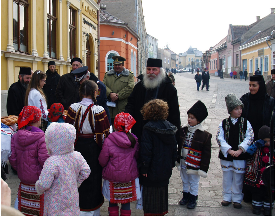
7. kép. Ioan Selejan érsek Csíkszeredában a román nemzeti ünnepen

taglalt beszédmódban kimutatható (a modernizációt leszámítva). Központi topozsa az ortodoxia mostoha sorsa, a Román Ortodox Egyház nehéz helyzete, illetve vallási-nemzeti missziója a székelyföldi régióban, az egyházi-vallásos nyelvezet és szemlélet pedig jól megkülönböztethetővé teszi. 66