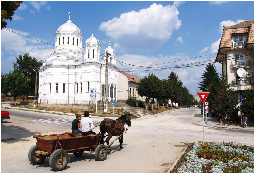
8. kép. Baróti utcakép

Az előbbire jó példa a már több mint húsz éve napirenden lévő romániai regionalizáció vitája. A fennálló megyék összevonásával kialakítandó régiók kapcsán a magyar érdekképviselet rendre a Székelyföld önálló régióként való megszervezését javasolja, amit a román politikai szereplők – reflexből – nemzeti alapon, a különféle szakértők pedig gazdasági érvekkel utasítanak el. Míg az előbbieket a nemzetállami eszmére és a román alkotmányra hivatkoznak, az utóbbiak szerint az etnikai szemponthoz való (magyar) ragaszkodás idejétmúlt, és gazdasági szempontból sem ésszerű. 76 A jelenleg érvényes, 1998-ban kialakított régiós beosztásban a Székelyföldet ugyan nem darabolták fel, mint egyes korábbi időszakokban, de a Központ ( Centru ) régió részeként erősen román többségű megyékkel vonták össze, Gyulafehérvár székhellyel. Ennek a struktúrának a megerősítése a megyék rovására hasonlóan elfogadhatatlannak számít a magyar elitnek szemében, mint a különféle más, a székely megyéket ide-oda rendezgető megoldások. 77 A magyar javaslatokra mintegy válaszképp számos román elemző és újságíró mutatott rá a székelyföldi autonómia gazdasági oldalának kérdőjeleire. Például Sorin Ioniță egy 2006-os írásában kifejezetten szegény régióként jellemezte a Székelyföldet,