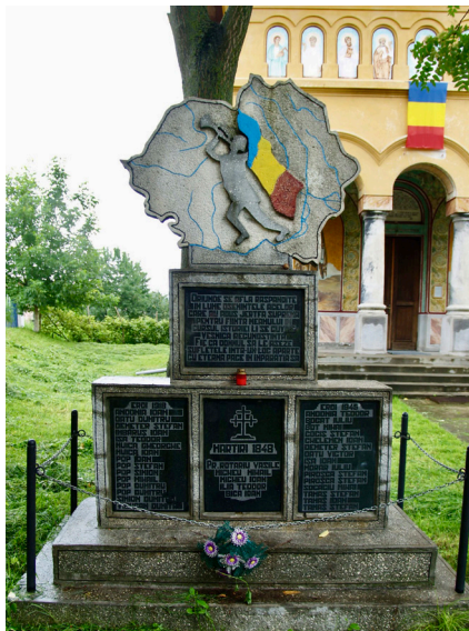
8. kép. Nagy-Románia, 1848 mártírjai, valamint 1918 és 1945 hősei emlékére állított kereszt az erdőszentgyörgyi ortodox templom kertjében (Forrás: a szerző felvétele, 2010)

megye román aktorainak tevékenységét – az ortodox papoktól a rendőrtiszteken és prefektusokon át a kutatókig és művészekig. Ez a különféle évkönyvek és