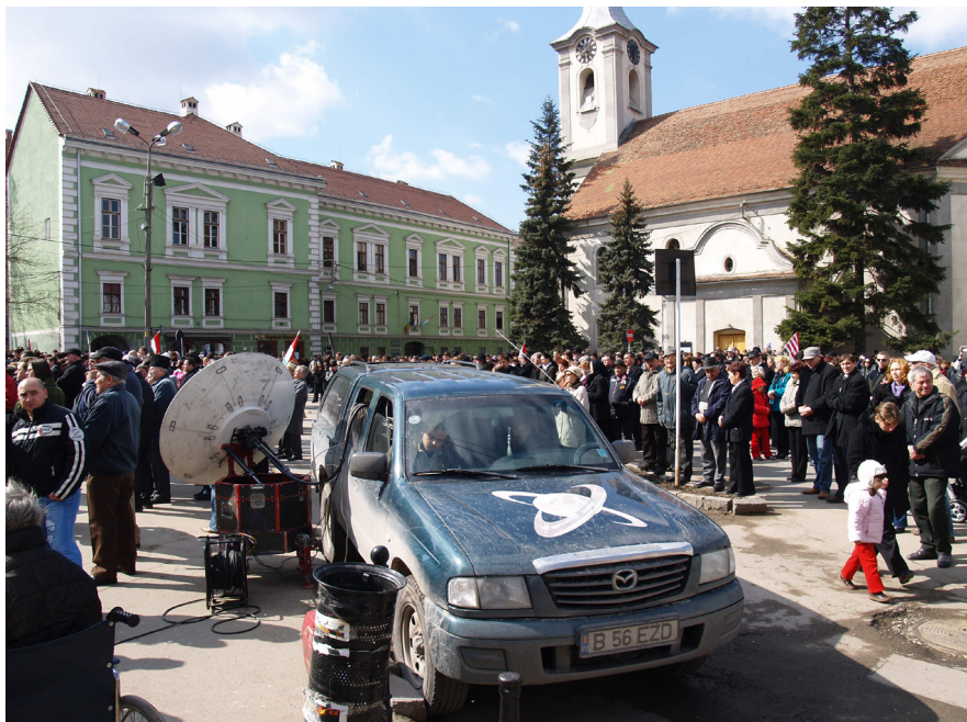
4. kép. Az egyik román kereskedelmi televízió autója egy székelyudvarhelyi március 15-i ünnepségen.

magyar állam fokozódó nemzetiesítő politikájában – és váltják ki őket a helyi magyar többség nem mindig toleráns attitűdjei. Mindezt a román nemzeti aktivisták nem is haboznak instrumentalizálni, kiegészítve a román „többségi mentalitás” 24 elemeivel: elsősorban a dominancia és az állam kisajátításának igényével.