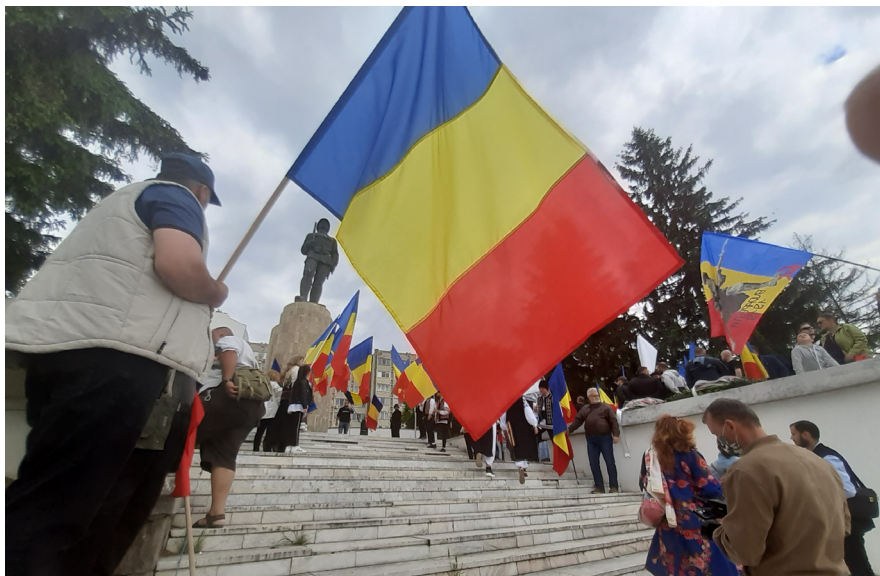
3. kép. Román megemlékezés a trianoni békeszerződés aláírásának 101. évfordulóján Sepsiszentgyörgyön.